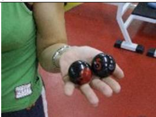
Sie sollen sich drehen