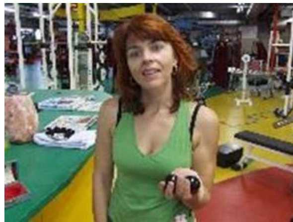
Freude an der Übung