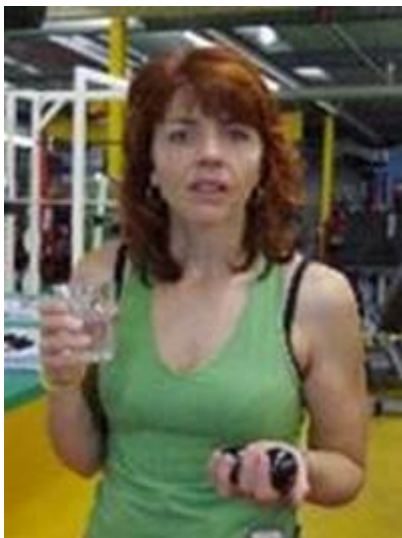
Anderthalb bis zwei Liter Wasser pro Tag trinken